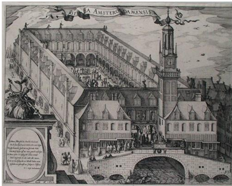
Εικόνα 4: Το Χρηματιστήριο του Άμστερνταμ στα 1612

εξελίξεις. Το 1598 ιδρύθηκε στο Άμστερνταμ Επιμελητήριο Ασφαλίσεων (Chamber of Assurance) που ρύθμιζε και επέβλεπε την κατοχύρωση ασφαλιστικών συμβολαίων και λειτουργούσε και ως δικαστήριο για επίλυση διαφορών. Είναι σαφές πως η δημιουργία του βοηθούσε την κατοχύρωση περιουσιακών δικαιωμάτων, μειώνοντας το κόστος συνδιαλλαγής. Το υπόδειγμα των partenrederij , ακολούθησαν οργανωτικά και άλλες μεγάλες εταιρείες για την εκμετάλλευση του εμπορίου με τις Δυτικές και Ανατολικές Ινδίες που περιλάμβανε όλη την Ασία. Εταιρείες των Ολλανδικών Δυτικών και Ανατολικών Ινδιών (VOC) ιδρύθηκαν, η VOC το 1602 και η WIC των Δυτικών το 1621, ενώ η ανάλογη της Αγγλίας, East India Company (EIC), είχε προηγηθεί το 1600.