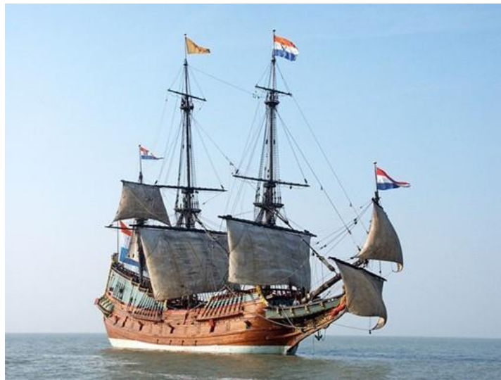
Εικόνα 3: Αντίγραφο (replica) του φημισμένου γαλεονιού Batavia, που ανήκε στην VOC