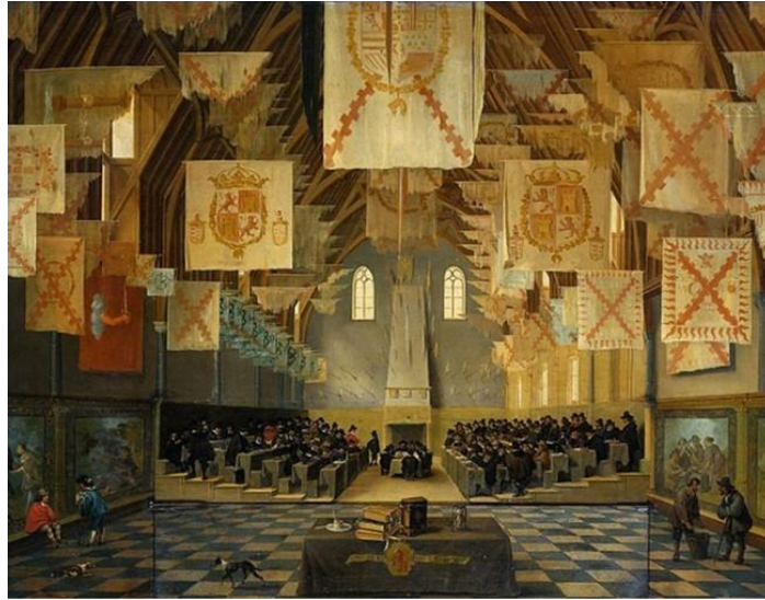
Εικόνα 1: Συνεδρίαση της Μεγάλης Συνέλευσης των Γενικών Τάξεων το 1651